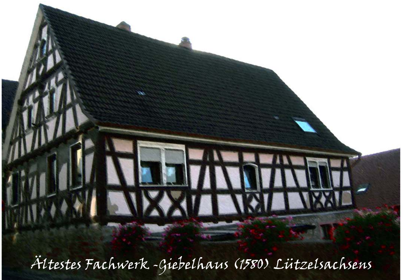
Ältestes Fachwerk -Giebelhaus (1580) Lützelsachsens